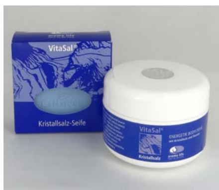
VitaSal Kristallsalz Seife 100g Fr. 6.90 Energetic Creme 100ml Fr. 25.00