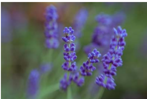
Lavendel Lavandula angustifolia