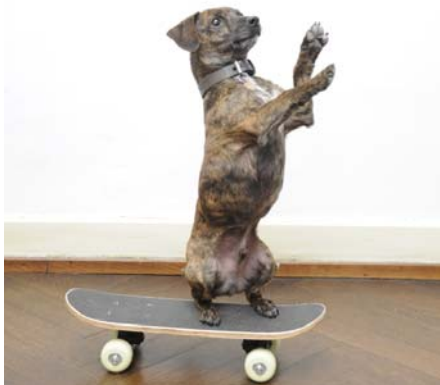
Entspannungskapseln für Tiere 100 Stück Fr. 25.50

Gerne veröffentlichen wir auch Ihren Erfolg mit unseren Produkten.