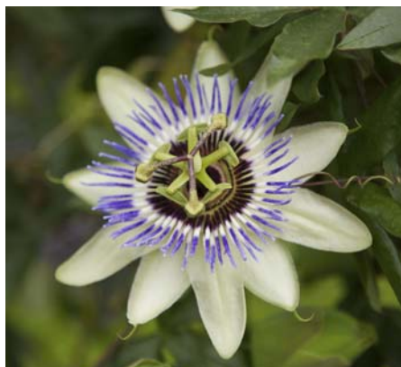
Entspannungskomplex Kapseln 200 Stück Fr. 49.00