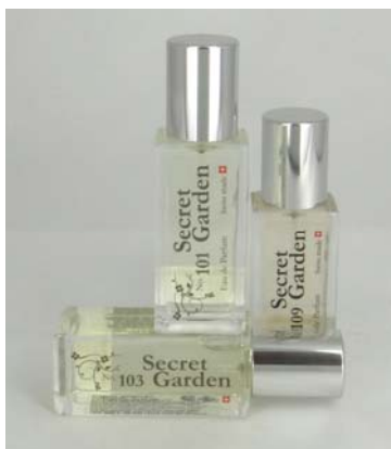
Secret Garden Eau de Parfum 16 ml Fr. 29.00