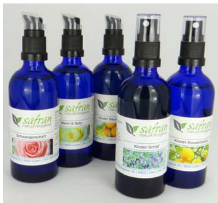
Raumspray 100ml Fr. 15.50 Einreibeöl 100ml Fr. 19.50