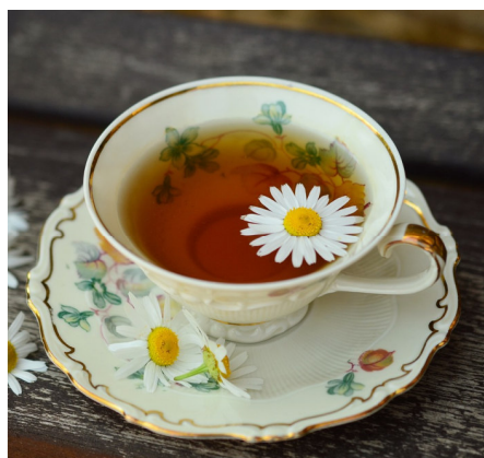
Hauseigene Genusstees 60g - 200g Fr. 9.80