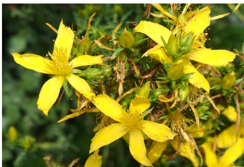
Johanniskraut Hypericum perforatum