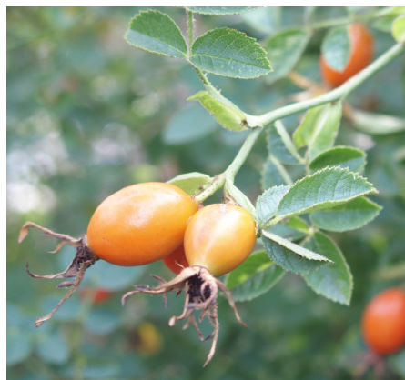
Knospenextrakt Hagebutte 50ml Fr. 31.80 100ml Fr. 56.80